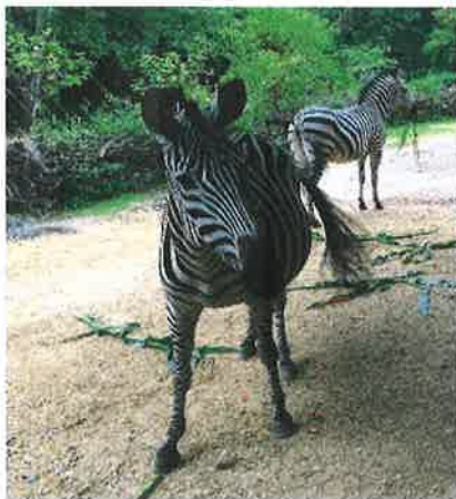
Selbst erlebt: Zebras mögen Maiskolben besonders – der Stiel wird später gegessen.