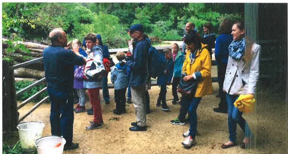
Führung durch den Zoo Basel und Fütterung der Patientiere