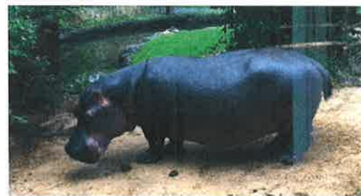
Und neues erfahren: Flusspferde können nicht schwimmen.