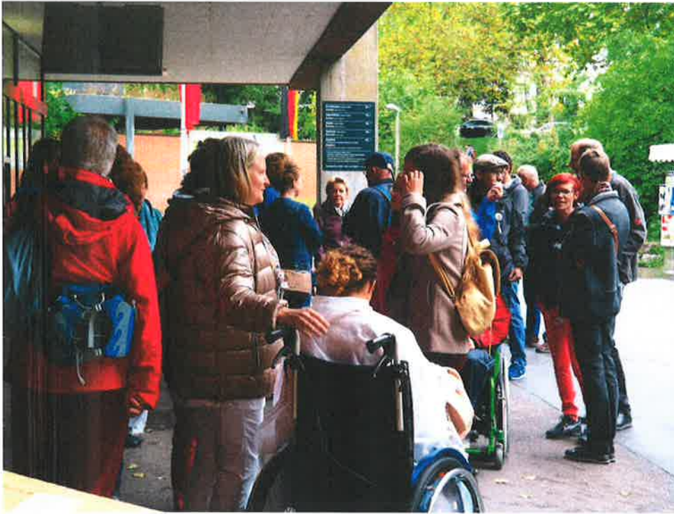
Freundlicher Empfang durch Vertreter von Zoo Basel, Kinderkrebshilfe Schweiz, Forum das andere Kind und der Stiftung für das leukämiegefährdete Kind